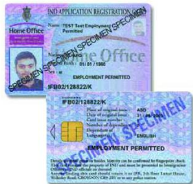
Enghraifft o ARC (blaen a chefn)

ARC sy'n nodi 'employment permitted' neu 'work allowed' a ffurflen wedi'i llenwi gan y Gwasanaeth Gwiriw Cyflogwr (ECS) sy'n cadarnhau bod y deiliad yn dal i fod â'r hawl i weithio. Argymhellir cynnal gwiriadau dilynol tebyg o leiaf unwaith pob 12 mis.