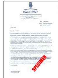
Enghraifft o lythyr gan y Swyddfa Gartref

Llythyr gan y Swyddfa Gartref a dogfen swyddogol a gyflwynwyd gan un o asiantaethau'r Llywodraeth, fel Cyllid a Thollau Ei Mawrhydi neu'r Adran Gwaith a Phensiynau, neu gan gyflogwr blaenorol yn nodi rhif Yswiriant Gwladol parhaol yr unigolyn a'i enw, a gwiriadau dilynol tebyg o leiaf unwaith pob 12 mis. Mae'r enghreifftiau o ddogfennau y gellir eu cyfuno gyda llythyr y Swyddfa Gartref yn cynnwys P45, P60 neu gerdyn rhif Yswiriant Gwladol.